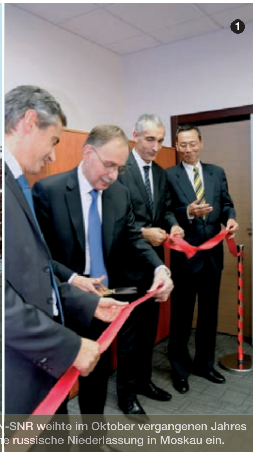
NTN-SNR weihte im Oktober vergangenen Jahres seine russische Niederlassung in Moskau ein.