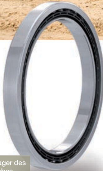
Traglager des Getriebes