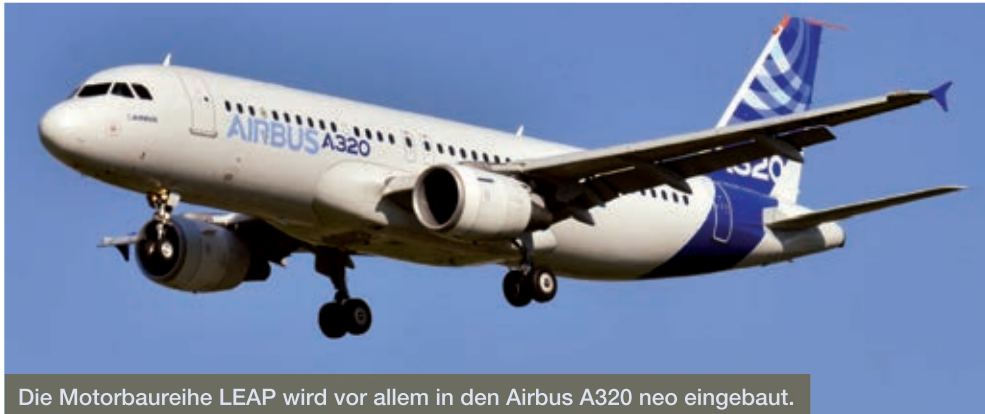
Die Motorbaureihe LEAP wird vor allem in den Airbus A320 neo eingebaut.

NTN-SNR gewann das Vertrauen von Snecma (Safran) zur Herstellung von Lagern für den Antriebsstrang der LEAP Motoren, die für die neuen Single-Aisle Verkehrsflugzeuge bestimmt sind.