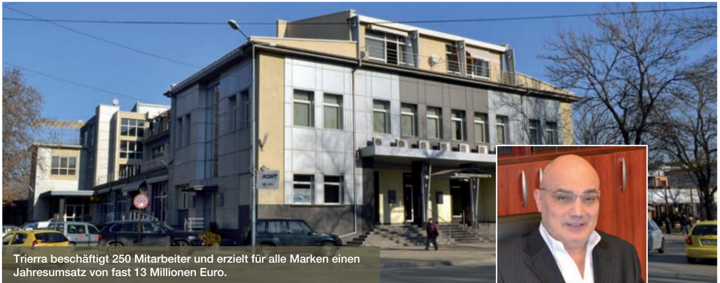
Trierra beschäftigt 250 Mitarbeiter und erzielt für alle Marken einen Jahresumsatz von fast 13 Millionen Euro.