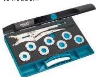
Tangset HAZET n° 1847-12/15