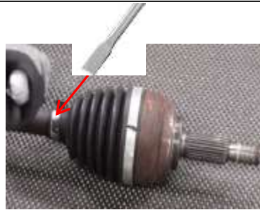
Beitel of platte schroevendraaier