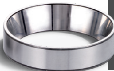
Pista superacabada com efeito refletivo