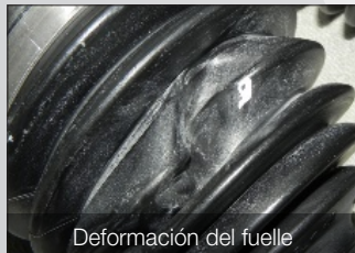
Deformación del fuelle