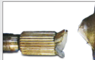
Rotura del vástago de la campana