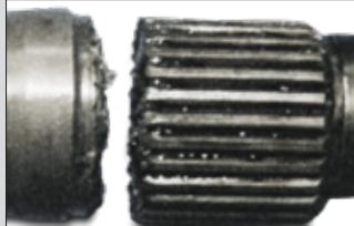
Rotura de elementos de conexión