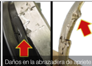
Daños en la abrazadera de apriete