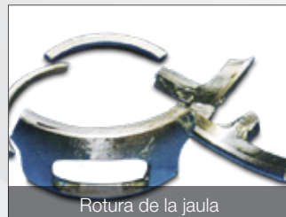
Rotura de la jaula