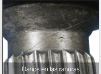
Daños en las ranuras