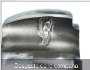
Desgaste de la campana