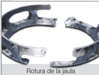
Rotura de la jaula