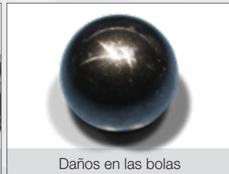
Daños en las bolas