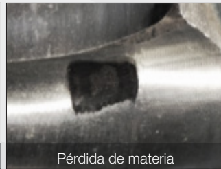
Pérdida de materia