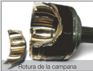
Rotura de la campana