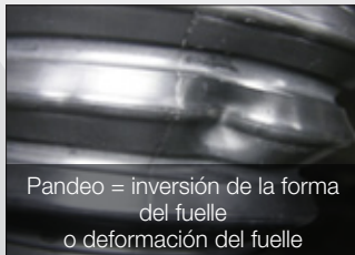
Pandeo = inversión de la forma del fuelle o deformación del fuelle