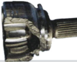
Rotura de la campana