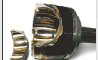
Rotura de la campana