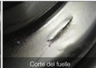
Corte del fuelle