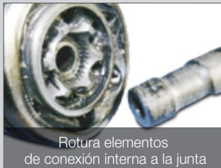
Rotura elementos de conexión interna a la junta