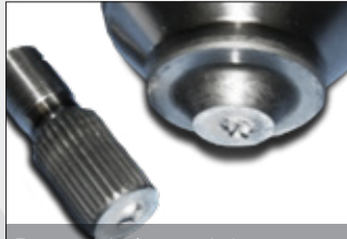
Rotura del vástago de la campana