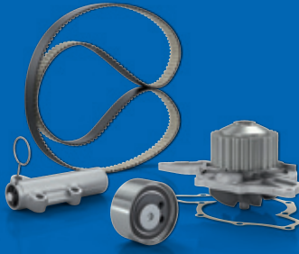
Su Pompalı Zamanlama Kitleri