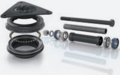
Süspansiyon, Torsiyon Kitleri