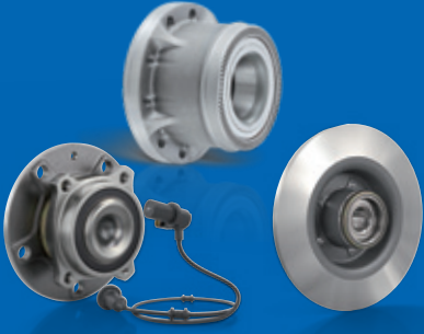
Teker Rulmanları, Sensörler, Fren Diskleri