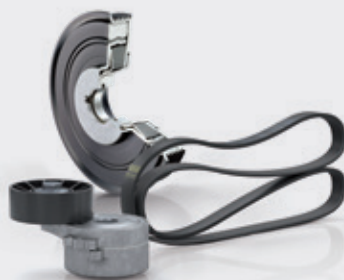
Aksesuar Kayış ve Avara Kasnakları