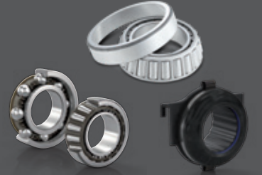
Şanziman ve Debriyaj Rulmanları