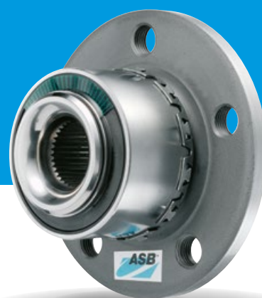
RODAMIENTOS SNR DE ORIGEN

Han aparecido en el mercado algunas copias con características no conformes, poniendo en peligro la vida de los automovilistas y de los pasajeros