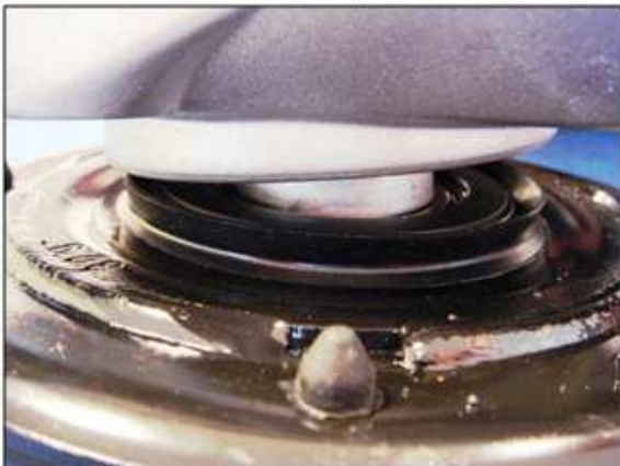
Inserimento del blocco filtrante nella coppa

Rispettare di montaggio della guarnizione: labbro stagno lato blocco filtrante