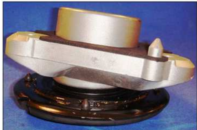
Aspetto finale dell'installazione