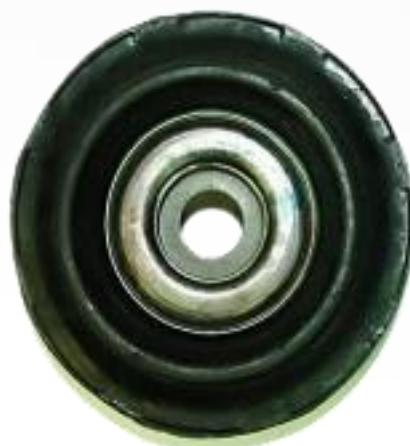
Cara del lado del marcado no visible