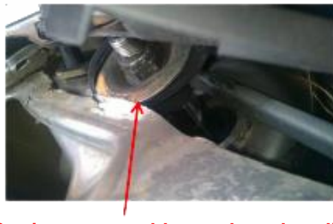
Conjunto tope y bloque de mala calidad Vástago de amortiguador atravesando la carrocería