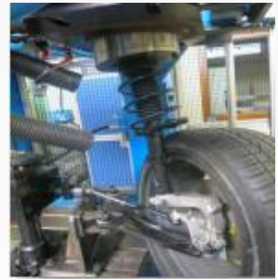
Banco de pruebas Suspensión en el Centro de Ensayos NTN Europe

Además se efectúan también pruebas mecánicas, químicas, dimensionales, metalúrgicas sobre el acero, y sobre los cauchos, a fin de ofrecer la mejor calidad posible.