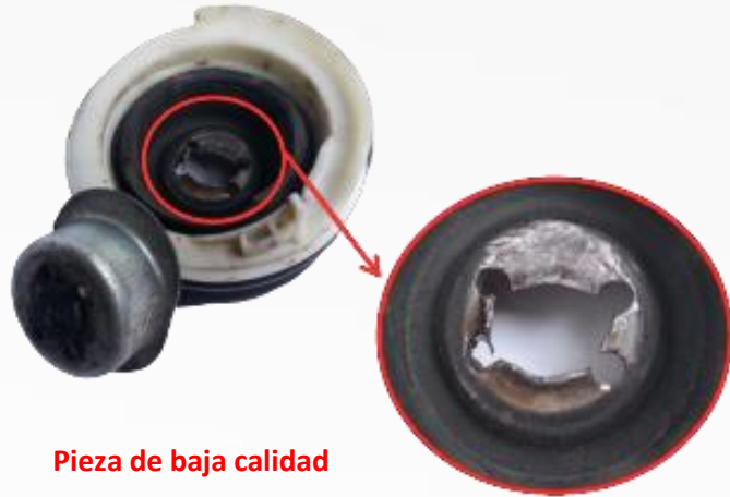
Pieza de baja calidad

Destrucción del inserto metálico del bloque filtrante por el vástago del amortiguador. El acero, al no ser de buena calidad, no ha resistido el choque, al contrario que el bloque filtrante de SNR.