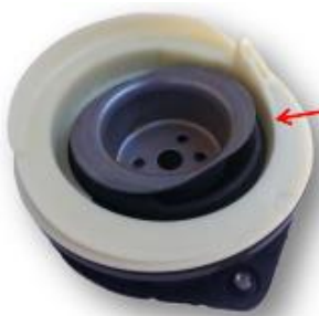
Tope de suspensión y bloque filtrante SNR

NTN Europe propone kits, en los que se incluyen los diversos componentes para facilitar el montaje (copelas, tornillos, tuercas...)