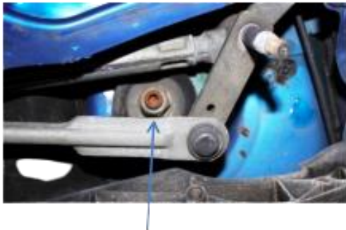
Tope de suspensión SNR

Además, en las piezas de baja calidad se da una mala adherencia del caucho con los insertos metálicos, lo que favorece la rápida aparición de roturas. El uso de estos productos puede tener como consecuencia que se produzca la perforación de la carrocería en caso de accidente.