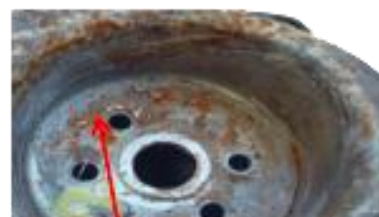
Corrosión provocada por la migración del muelle