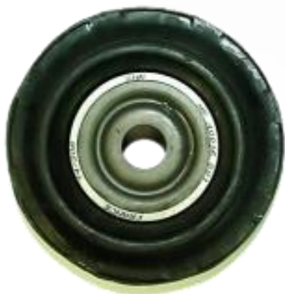
Cara del lado del marcado visible