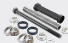
KITS DE BRAS DE SUSPENSION KS 5

Choisir l'offre SNR, c'est choisir la qualité et la performance.