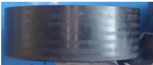
Aspecto de la polea

Si la correa se tensa de manera incorrecta y se mueve sobre el rodillo tensor, esta puede desplazarse y desalinearse. Cuando esto ocurre, se marca el sobremoldeado de poliamida del diámetro de bobinado de la polea.