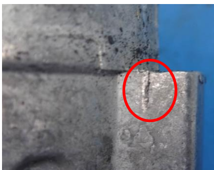
Marcas en los topes

Las marcas en los topes nos muestran que el brazo tensor ha estado rebotando de un lado a otro de los topes del tensor. Cuando el tensor funciona correctamente, el brazo tensor actúa entre los dos topes pero nunca llega a tocarlos.