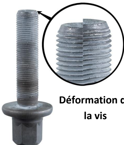
Déformation de la vis

Le boulon (vis+ écrou) est un M18 x 1.5 avec une longueur maxi de 85.5 mm . Il est impératif d'utiliser une vis avec rondelle.