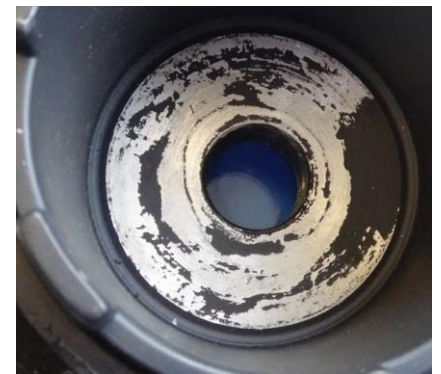
Face d'appui de la rondelle de maintien frottant à cause du jeu

La vis de fixation de la poulie de vilebrequin nécessite un serrage correct en quatre étapes : 100N.m + 60° + 30° + 60° . En cas de mauvais serrage, il y a un risque de rendre la poulie bruyante.