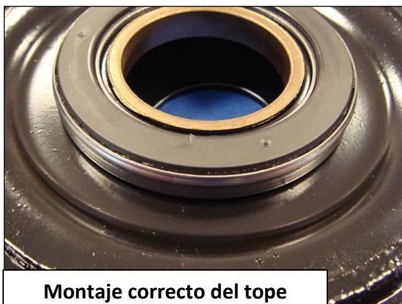
Montaje correcto del tope

Respetar el sentido de montaje del tope: cara metálica no visible