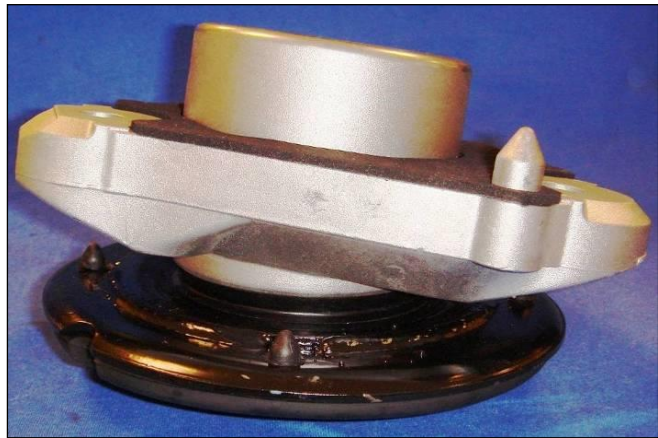
Aspecto del ensamblaje final