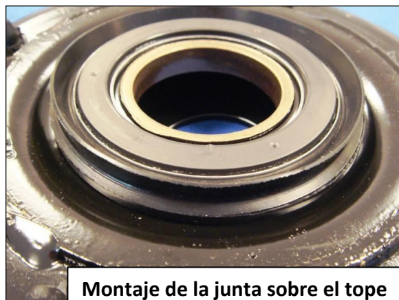
Montaje de la junta sobre el tope