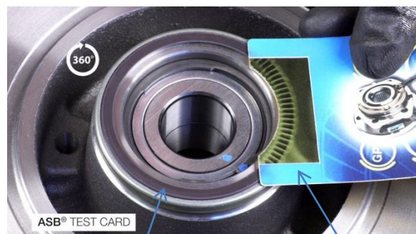
Junta ASB® codificada magnéticamente