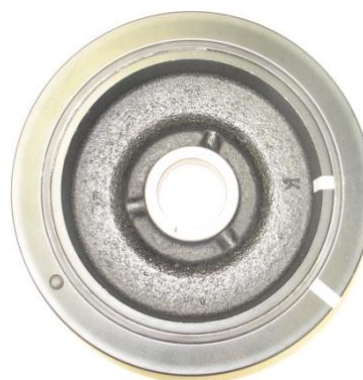
Desfasamento de marcas: O amortecedor deve ser trocado .