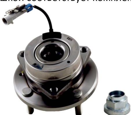
ОЕ номер 96639585 R190.06

Визуальный осмотр необходим, чтобы определить модель подшипника, используемую на данном транспортном средстве: подшипнику с металлической крышкой соответствует комплект R190.06.