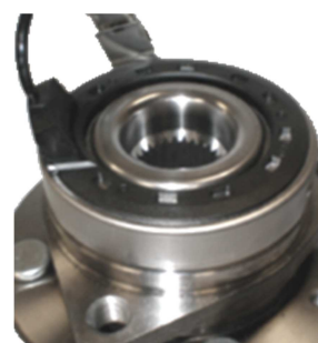
Rif. OE 96812619 R190.23