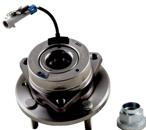
Rif. OE 96639585 R190.06

Se viene installato il cuscinetto errato si va incontro ad un difetto dell'ABS. Pertanto bisogna controllare il cuscinetto onde determinare quale dei due deve essere installato sul veicolo: il cuscinetto con il coperchio metallico corrisponde al kit R190.06.