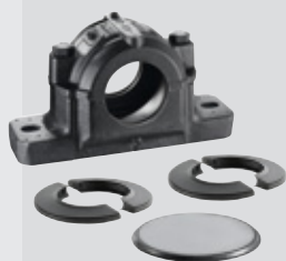
Supporto ritto SNC + 2 tenute DS a doppio labbro + coperchio chiuso