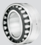
ULTAGE Cuscinetto orientabile a rulli aperto con alesaggio conico