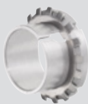
Bussola di serraggio