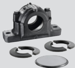
Supporto ritto SNC + 2 tenute DS a doppio labbro + coperchio chiuso