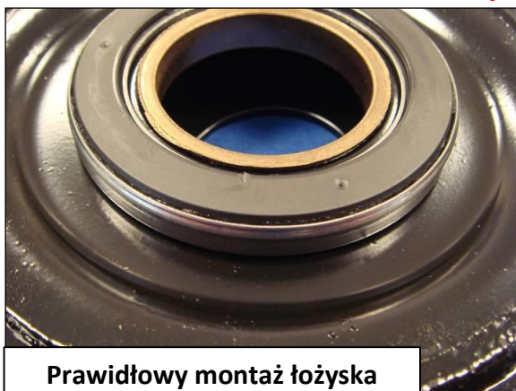
Prawidłowy montaż łożyska

Przestrzegać montażu łożyska we właściwą stronę : strona metalowa nie powinna być widoczna