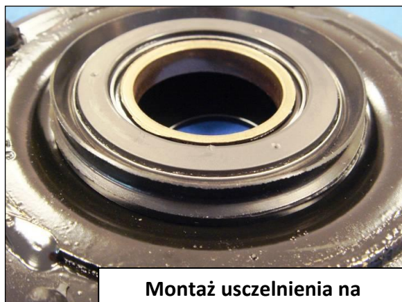
Montaż uszczelnienia na łożysku