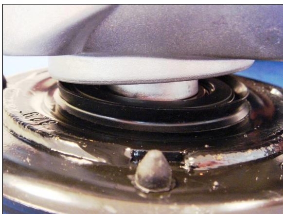
Umieszczenie poduszki w obudowie

Montować uszczelkę we właściwą stronę : warga uszczelniająca po stronie poduszki