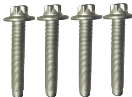
R159.65: Citroën C4 Picasso II