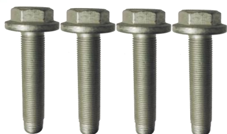
R159.64: Peugeot 308 II