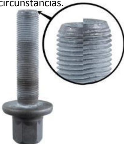
Deformação do parafuso

Vestígios de lascagem na face de contacto frontal da polia são uma indicação de um parafuso de fixação mal apertado.