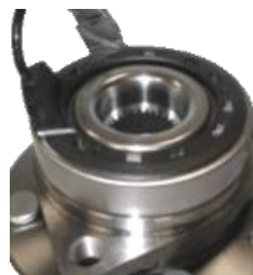
Ref. OE 96812719 R190.23