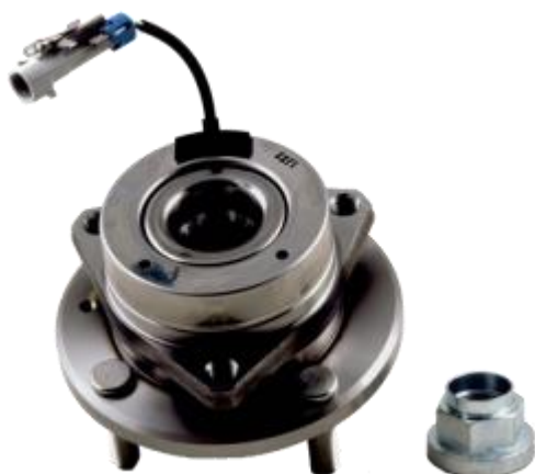
Ref. OE 96639585 R190.06

É necessária uma inspeção visual para determinar qual dos rolamentos deve ser instalado no veículo: o rolamento com a cobertura metálica corresponde ao kit R190.06.