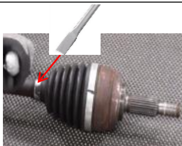
Dłuto lub płaski wkrętak