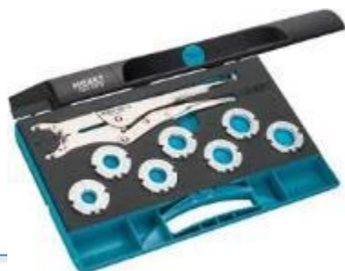
Zestaw szczypców HAZET n° 1847-12/15