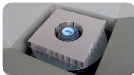
Картонный держатель для защиты подшипника

Тормозной диск надёжно зафиксирован внутри коробки картонными держателями, защищающими магнитное уплотнение от повреждений во время перемещений. Основная информация о тормозном диске и сенсоре ASB указана на упаковке и доступна на 6 языках.