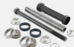
KITS DO BRAÇO DA SUSPENSÃO KS

Escolher produtos da gama SNR significa escolher qualidade e desempenho.