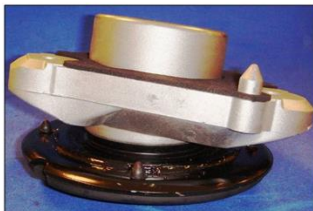
Aspect de l'assemblage final