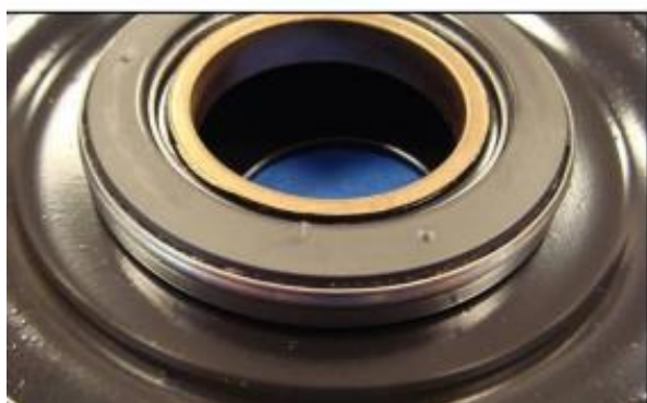
Assemblage correct de la butée

Respecter le sens de montage de la butée : face métallique non visible