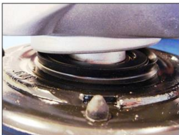
Emménagement du bloc filtrant dans la coupelle

Respecter le sens de montage du joint : lèvre d'étanchéité côté bloc filtrant