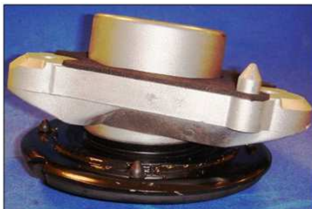
Внешний вид окончательной сборки