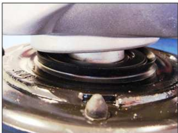
Установка блока фильтра в держателе

Соблюдайте направление установки уплотнения: уплотнительная кромка должна быть направлена к резиновой опоре.