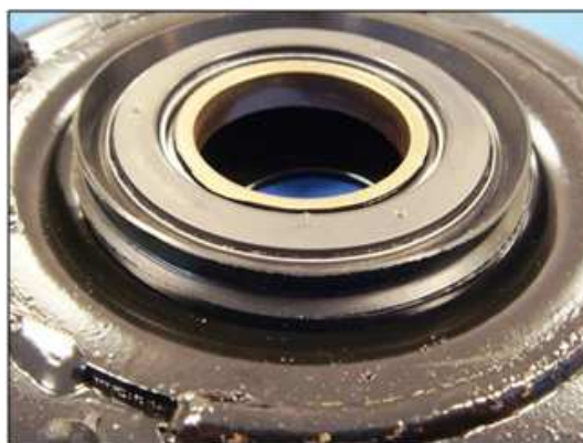
Установка уплотнения на опору

Соблюдайте направление установки уплотнения: уплотнительная кромка должна быть направлена к резиновой опоре.